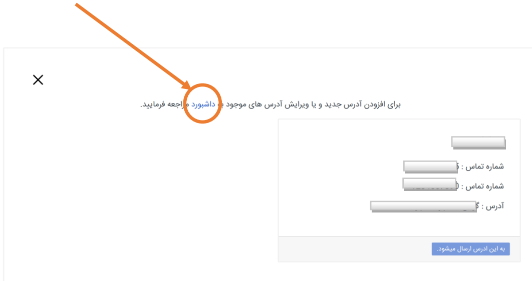
شکل ۶ - انتخاب آدرس ارسال سفارش

با کلیک بر روی داشبورد به صفحه ی زیر هدایت می شوید که میتوانید لیست آدرس های خود را مشاهده و اقدام به ویرایش آنها کنید.