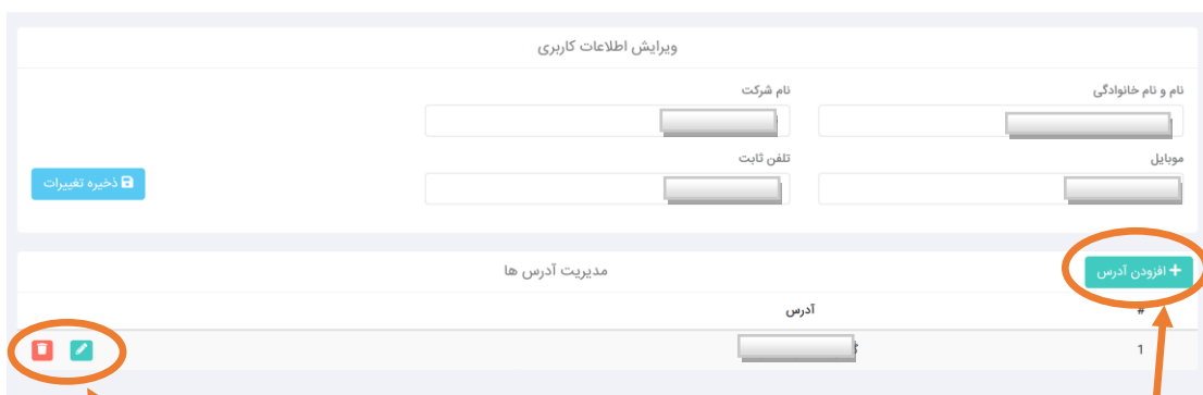
شکل ۷ - مدیریت آدرس ها

با کلیک بر روی داشبورد به صفحه ی زیر هدایت می شوید که میتوانید لیست آدرس های خود را مشاهده و اقدام به ویرایش آنها کنید.