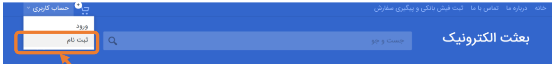
شکل ۱- ثبت نام

برای ثبت نام، بر روی لینک مشخص شده در تصویر زیر کلیک کنید.