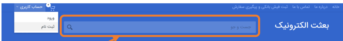
شکل ۲- جست و جو

برای این منظور ابتدا در کادر جست و جو، نام قطعه یا بخشی از مشخصات آن تایپ شود، هرچه مشخصات دقیق تر وارد شود، تعداد نتایج محدودتر و پیدا کردن قطعه آسان تر می شود.